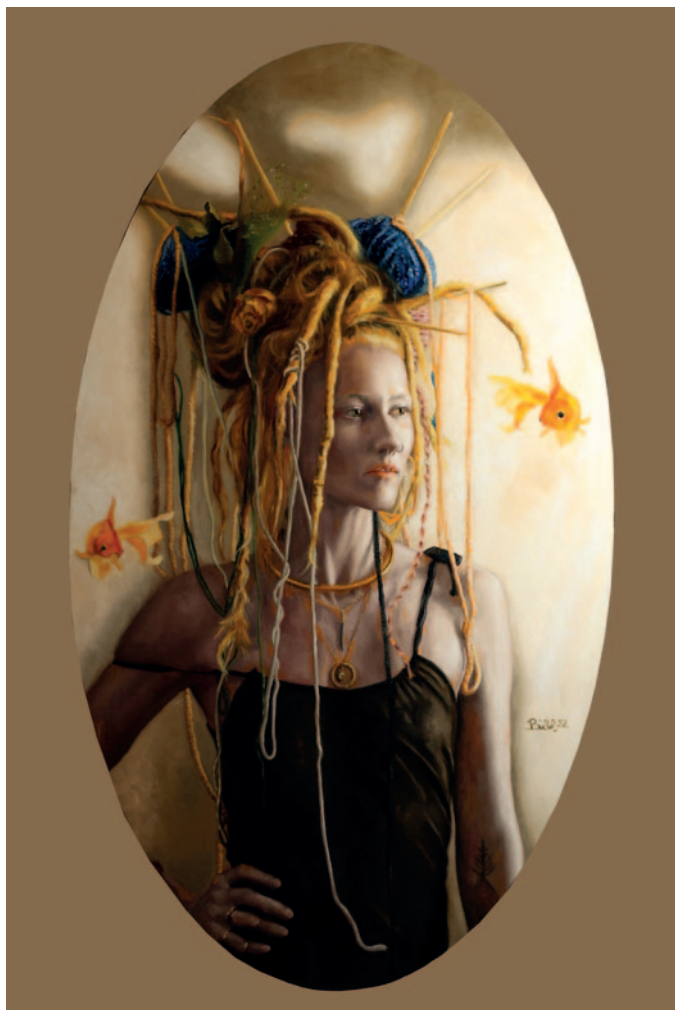
MIKE BÜCHEL (Innsbruck 1981 geb.) „Leo and the goldfish“ signiert, datiert 2022 Öl/Dipond, 157 x 90 cm